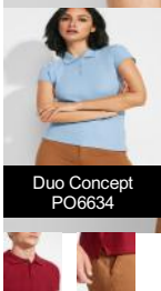
Duo Concept PO6634